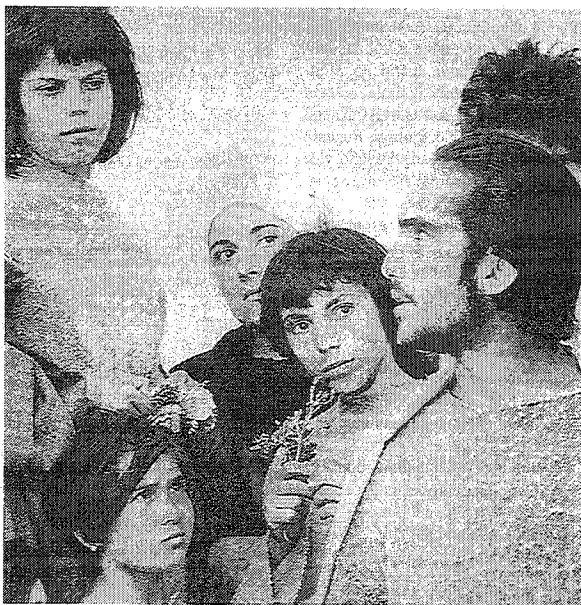
Een scène uit 'Il Vangelo secondo Matteo' van Pasolini

schakelen haar gelijk aan deelindrukken. Deze inperking vindt vaak plaats in het bereik van de gevoelens (bijvoorbeeld wanneer iemand verliefd wordt of toekomstdromen najaagt). En nóg vaker vermengen wij onze ervaring met vooroordelen en opvattingen die wij misschien onbewust van onze omgeving hebben overgenomen. In plaats van open te zijn in een houding van verwachting, eerlijke opmerkzaamheid en afhankelijkheid -een houding die de ervaring ten diepste verlangt- overstelpen wij onze ervaring met allerlei categorieën en beoordelingen. Hiermee willen wij onze ervaring verklaren, maar in feite belemmeren en vernauwen wij haar. Het sprookje van de "wetenschappelijke vooruitgang die op een dag al onze behoeften zal oplossen" is een moderne uitdrukking van deze onbehouden en afstotelijke aanmatiging: zij houdt geen rekening met onze wérkelijke behoeften en weet niet van welke aard ze zijn. Zij sluit niet alleen de nuchtere beschouwing van de ervaring uit, maar ook het menselijke in alles wat dit verlangt. En zo laat de hedendaagse maatschappij ons blind rondwalen tussen een verbitterde aanmatiging en duistere wanhoop.