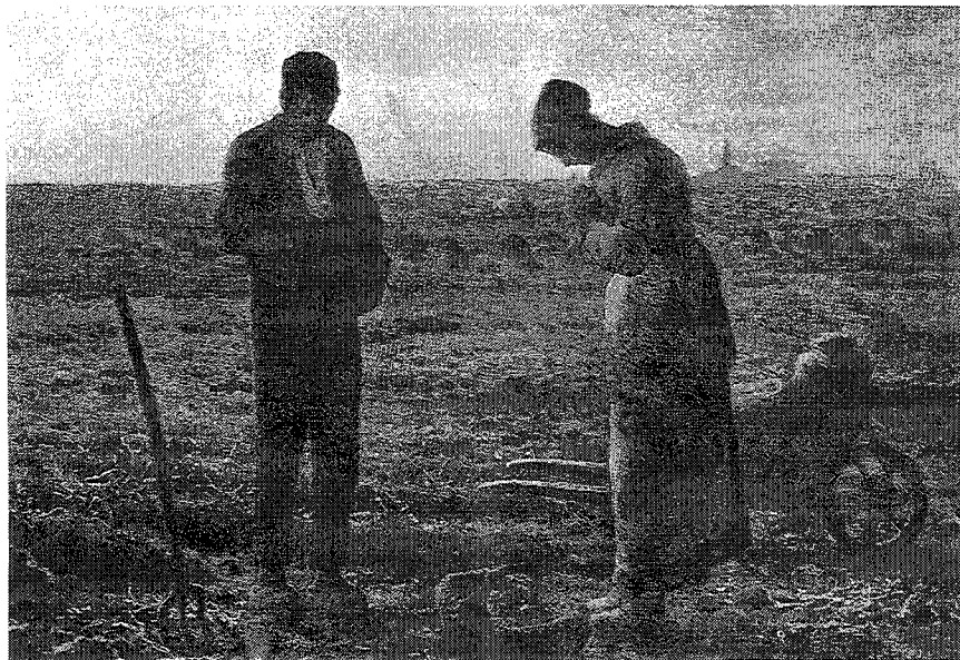
Het Angelus, Jean-François Millet, Musée d'Orsay, Parijs.

Daarom hebben wij ook allemaal de houding van de verwachting van die 'Ander', die ons helpt, met elkaar gemeen. Van nature is deze houding gemeenschappelijk en wel zo zeer, dat ieder die haar leeft zich met allen als 'één hart en één ziel' verbonden weet.